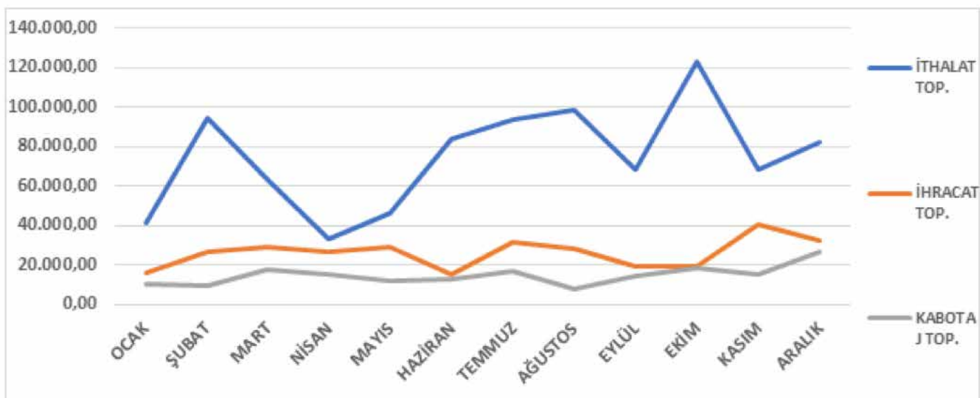
Grafik 1: Genel Yük İhracat, İthalat ve Dahili Kabotaj İşlemlerinin Aylara Göre Dağılımı

Limanımızda 2022 yılında 405 adet genel yük gemisine hizmet verilerek; 314.512,68 ton ihracat, 897.741,85 ton ithalat ve 178.630,01 ton kabotaj olmak üzere toplam 1.390.884,54 ton yüke, yükleme ve boşaltma hizmeti verilmiştir. 2022 yılı Ekim ayında 160.784,33 ton ile aylık bazda en üst seviyesine ulaşmıştır.